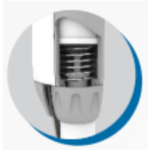
Pistón con asistencia magnética para resultados precisos

Micropipeta autoclaveable de volumen variable, diseño ergonómico con peso distribuido y pistón magnético que evita el cansancio en el trabajo de rutina. Sistema de seguridad en el volumen para evitar imprecisiones en el pipeteo. Con código de colores en el botón. Calibración según norma ISO 8655-6, calibración simple sin el uso de herramientas, fabricada con materiales de gran durabilidad y alta resistencia química.