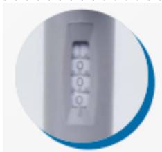
Visualización grande y claro de 4 dígitos