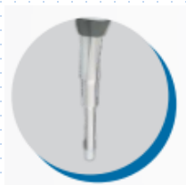
Punta de aleación especial para alta resistencia química