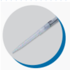
Compatible con puntas universales